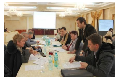
Ședința de consultare publică a documentului PRS EE