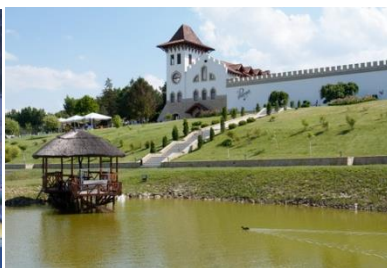
Complexul turistic „Purcari”