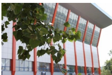
Complexul Sportiv din Căușeni