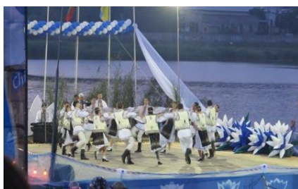
Festivalul „Nufărul Alb” din Cahul

ADR Sud promovează, prin toate mijloacele de informare de care dispune, modalitățile de accesare a surselor alternative de finanțare, anunță despre sesiunile de informare și instruire organizate în regiune, promovează potențialul investițional al Regiunii de Dezvoltare Sud, inclusiv potențialul turistic, oferind în acest sens un spectru larg de informații tuturor actorilor interesați.