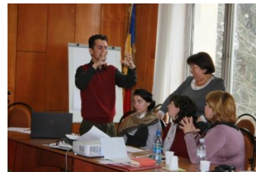
Training „Educația non-formală a adulților”

La atelier au participat reprezentanți ai ONG - urilor, pedagogi, psihologi, asistenți sociali, specialiștii Agențiilor pentru Ocuparea Forței de Muncă din Cimișlia și Basarabeasca. Activitatea a avut drept scop facilitarea accesului adulților din Regiunea de Sud la servicii educaționale, bazate pe nevoi reale de învățare.