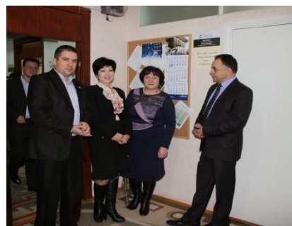
Ziua ușilor deschise la ADR Sud

desemnați câștigătorii, 2 posturi locat de televiziune, Bas TV și Cim TV, premiera cărora a avut loc în cadrul unui eveniment „Ziua ușilor deschise în ADR Sud”, desfășurat în decembrie curent.