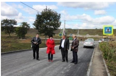
Construcția drumului Codreni - Sagaidacul Nou