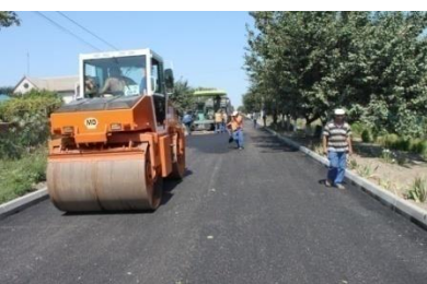
Drumul Ștefan Vodă - Talmaza

Ca o totalizare a rezultatelor obținute în anul 2013 în comparație cu anii precedenți 2011-2012 vine analiza executării planului bugetar consolidat pentru anii 2011, 2012 și 2013 expusă în tabel: