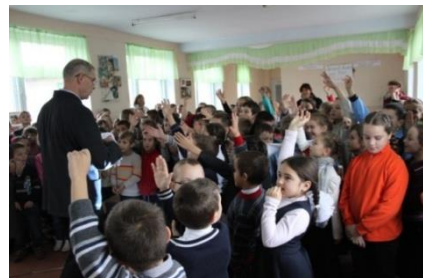
Training-uri organizate în școli

➤ În perioada de raportare a continuat colaborarea cu partenerii de dezvoltare în vederea selectării potențialelor proiecte care ar putea fi finanțate din surse externe. Astfel în cadrul secției Management Proiecte au fost analizate proiectele din DUP care sunt conexe cu domeniul de activitate al GIZ și prevăd îmbunătățirea sau regionalizarea serviciilor publice. Au fost selectate 3 proiecte („Construcția apeductului magistral Leova – Iargara”, “Construcția apeductului magistral Leova-Hănăseni Noi - Filipeni - Romanovca”, “Gestionarea integrată a deșeurilor menajere solide în raionul Cimișlia”) și prezentate către GIZ.