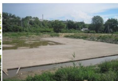
„Lacul Sărat” din Cahul