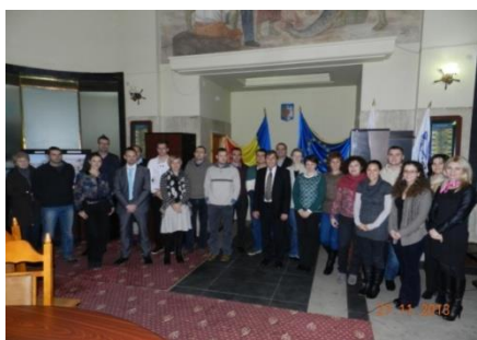
Vizita în Portul Giurgiu din România

Republica Moldova mărginește Dunărea pe un sector de 460 metri. Deși este o porțiune mică, este foarte importantă sub aspectul asigurării navigației internaționale și are funcția de coridor de transport pe Dunăre. Pe acest sector este amplasat portul liber internațional Giurgiu-lești, care din an în an se extinde, și pe viitor va fi capabil să administreze toate serviciile portuare. Din aceste considerente participarea Moldovei în proiectul CO-WANDA este