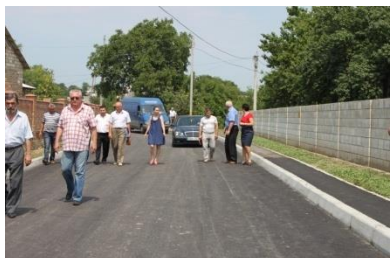
Renovarea drumului din Zaim