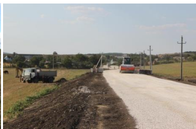
Construcția drumului Dimitrova - Acui