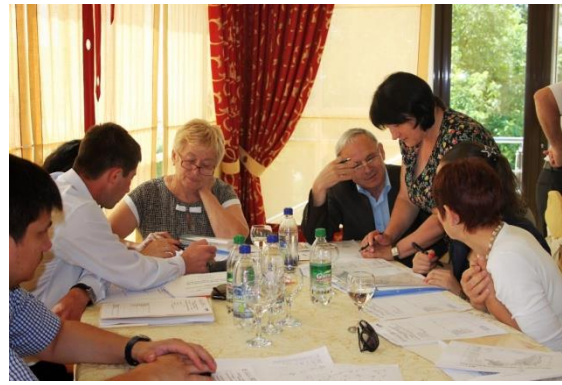
Atelier nr. 3 „Planificare regională în sectorul AAC”