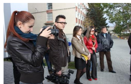
Relațiile cu mass-media și furnizarea informațiilor solicitate

2013 au demarat filmările pentru a II-a ediție specială a emisiunii „Reporter de Gardă”, dedicată eforturilor de a crește calitatea apei în raionul Cahul, pusă pe post la 04.07.2013.