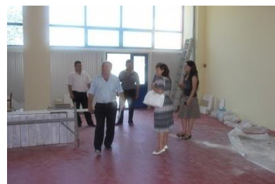
Evaluarea proiectului Complexul Sportiv din Căușeni

În lunile iunie-iulie 2013, specialiștii de la Ministerul Dezvoltării Regionale și Construcțiilor (MDRC) și Agenția de Dezvoltare Regională Sud (ADR Sud) au evaluat impactul proiectelor ”Turismul sportiv în promovarea imaginii Regiunii Sud - Complexul Sportiv Căușeni”, ”eficientizarea managementului DMS în RDS”, ”Construcția drumului de acces Dimitrova-Acui”.