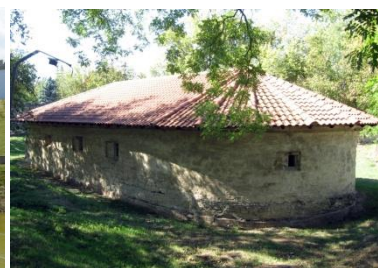
Biserica „Adormirii Maicii Domnului” din Căușeni