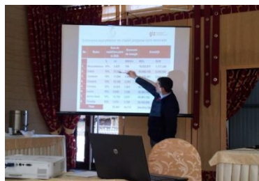
Atelier nr. 3 „Planificare regională în sectorul EE”