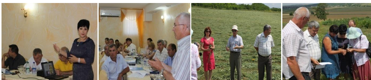
Seminar "Gestionarea pășunilor - garanția dezvoltării eficiente a sectorului animalier în condiții de secetă