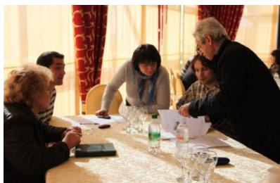
Atelier nr. 2 „Identificarea CPP în sectorul EE”

În primul trimestru al anului 2014 programul regional de EE urmează să fie ajustat conform propunerilor colectate și înaintat către CRD Sud pentru aprobare.