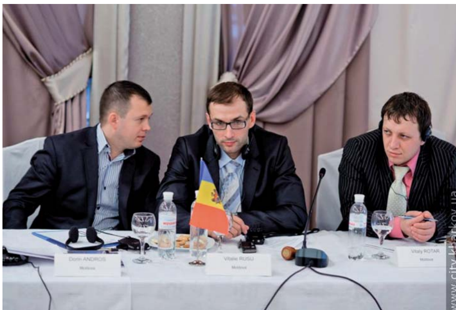
▲ Delegația Republicii Moldova în cadrul atelierului de lucru