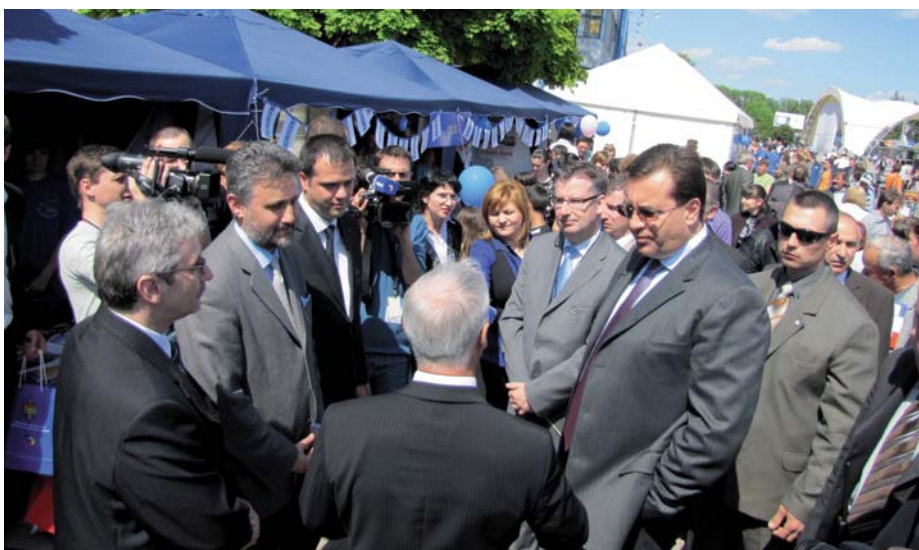
^ Ziua Europei la Bălți

În legătură cu desfășurarea Zilelor Europei pe parcursul a 2 săptămîni în luna mai, MDRC în colaborare cu ADR Nord, Centru și Sud au organizat un șir de evenimente consacrate acestei sărbători. În acest sens a fost organizată Ziua Ușilor deschise la toate ADR-le. La Bălți a avut loc o conferință studențească dedicată Zilei Europei și s-a desfășurat o masă rotundă cu tematica: "Oportunități investiționale în RD Nord a Republicii Moldova pentru România și alte țări ale UE".