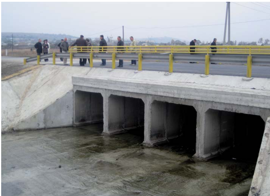
^ Podul peste riul Cogilnic

100 000 de locuitori ai raioanelor Basarabeasca, Cimișlia, Hîncești, din municipiul Chișinău, satul Cioc – Maidan (Găgăuzia), satul Tvardița, raionul Taraclia care traversează frontiera cu Ucraina prin punctul internațional “Basarabeasca - Serpnevoe”. Acest obiectiv a fost realizat în 45 de zile și a costat circa 2 mil. lei, bani alocați din FNDR.