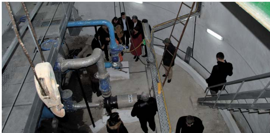
^ Vizita de studiu la stația de pompare, Călărași