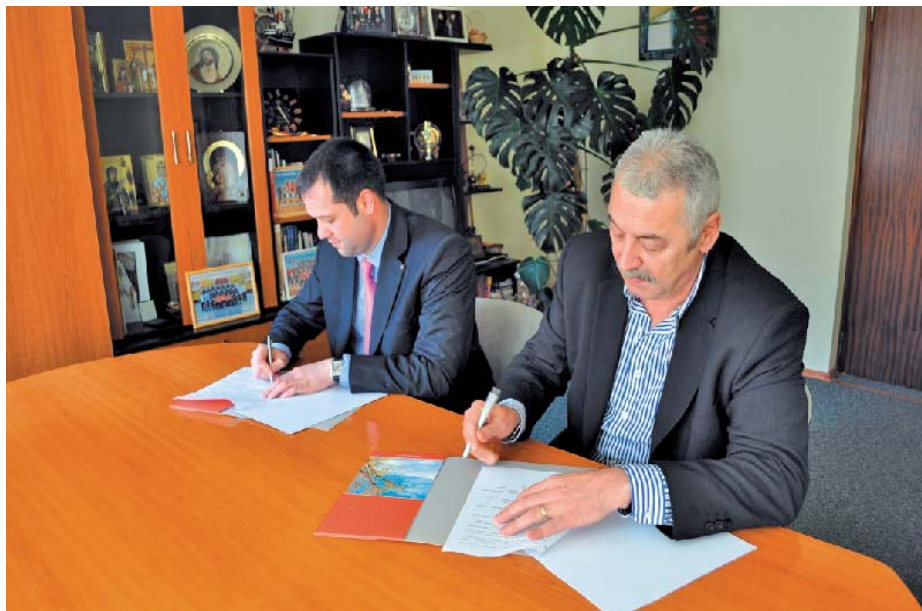
^ Semnarea Memorandumului de înțelegere între ADR Nord, Republica Moldova și ADR NORD-EST, România