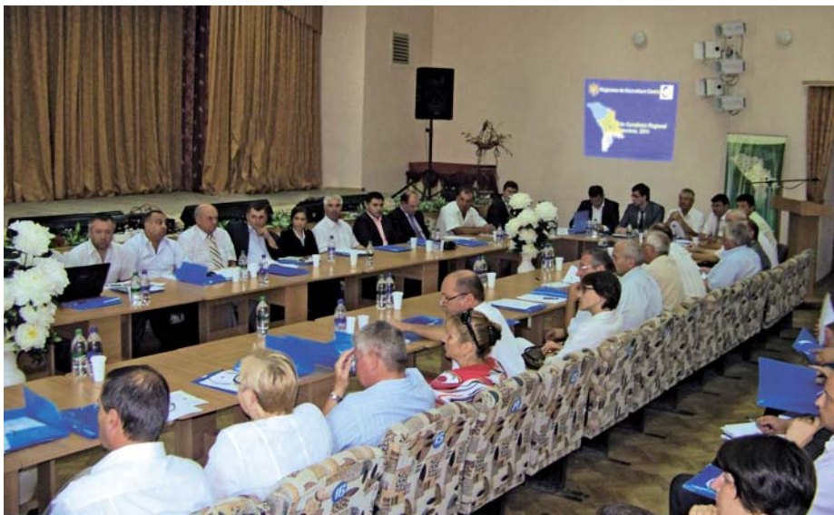
^ Ședința CRD Centru în noua componență

Pe parcursul perioadei de raportare au fost desfășurate un șir de instruirii privind dezvoltarea capacităților noilor membri ai CRD, în toate cele trei regiuni de dezvoltare.