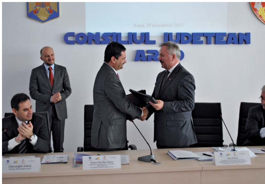
v Semnarea Protocolului de colaborare între RD Nord, Moldova, și RD Vest, România

Prin încheierea Memorandumului de înțelegere se dorește crearea unui parteneriat eficient în vederea inițierii și implementării ulterioare a acțiunilor comune orientate spre stabilirea unei colaborări durabile și de succes între ADR Nord, Republica Moldova și ADR Nord-Est, România.