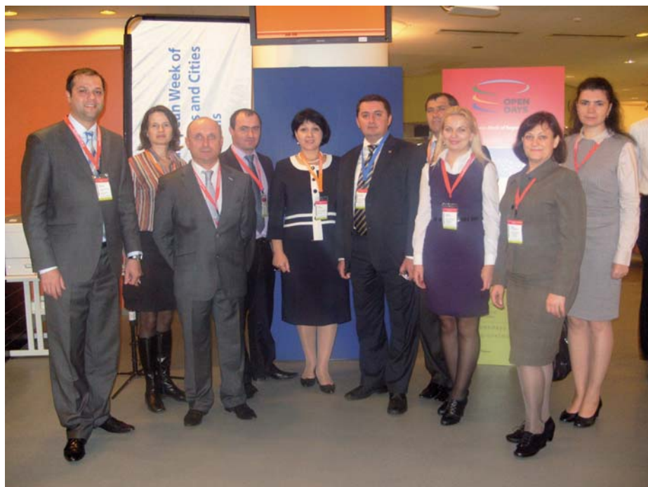
↗ Vizita de studiu în Letonia și Belgia

cadrul legal de activitate a instituției, sistemul statistic european, euro-indicatorii, ș.a. a fost prezentată statistica în contextul Politicii Europene de Vecinătate.