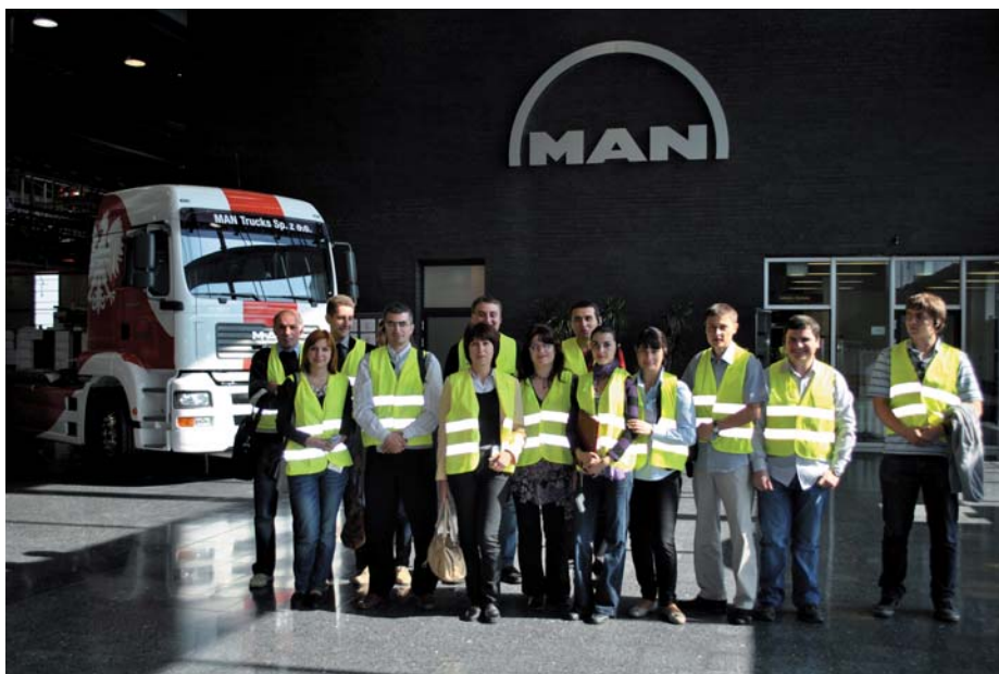
^ Vizita de studiu în Polonia

Programul vizitei de studiu, cofinanțat în cadrul Programului "Asistența Poloniei pentru străinătate" al Ministerului Afacerilor Externe al Republicii Polone în anul 2011, a cuprins mese rotunde, conferințe, vizite de documentare la șantiere și firme, întâlniri și discuții cu participarea autorităților locale poloneze.