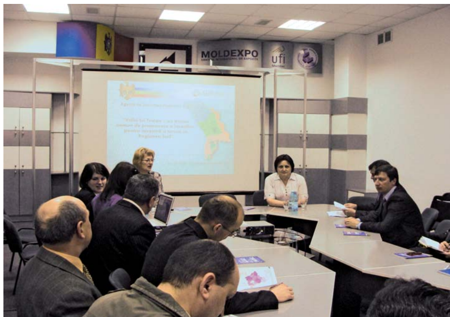
▲ Masa rotundă în cadrul Moldexpo unde se prezintă potențialul turistic în regiuni

ziție, MDRC a organizat o masă rotundă la care a prezentat potențialul turistic în RD, proiectele ce promovează turismul. Evenimentul a fost organizat în colaborare cu AN-TREC, cu participarea Agenției Naționale a Turismului.