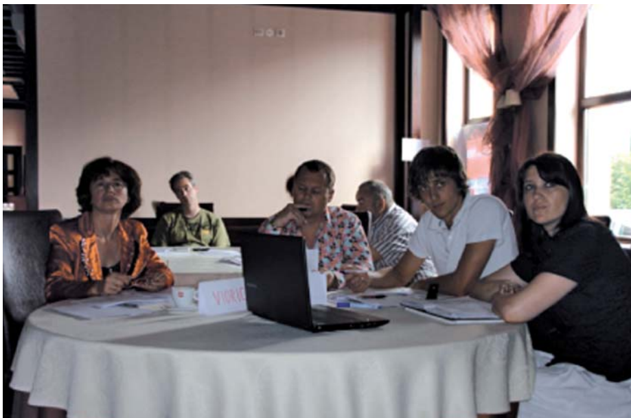
^ Reprezentanții Republicii Moldova la cursul de instruire din Iași, România.

Trainers în cadrul proiectului “Dezvoltarea administrației publice locale spre standardele UE și bune practice”, care s-a desfășurat în Iași, România.